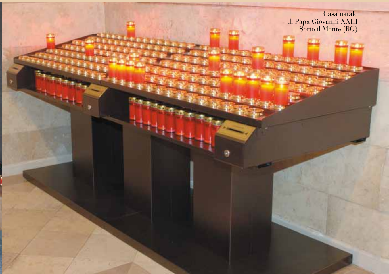
Casa natale di Papa Giovanni XXIII Sotto il Monte (BG)